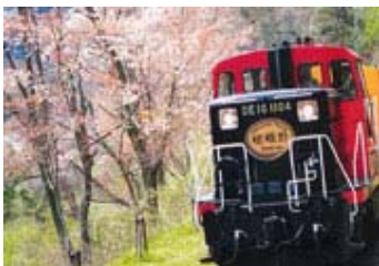
嗟峨野浪漫小火車

Miho 美術館位在一個山谷之中，為著名的建築大師貝聿銘所設計的。古代埃及、希臘、羅馬、中國、西亞洲、南亞洲等世界優秀美術品約 200 件及日本美術品約 200 件同時展出。