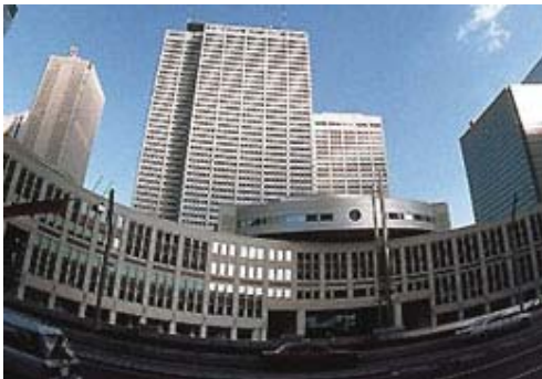
新宿：京王廣場大飯店 (Keio Plaza)

這南北不到 200 公尺，東西大約 700 公尺的區域裡，集中了大阪最燈紅酒綠的餐館，也匯聚了最大量的日本小吃美食，大阪有「天下之廚房」的美譽，而這裡是大阪美食之中心。