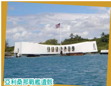
亞利桑那戰艦遺骸

遊覽第二次世界大戰日本偷襲珍珠港歷史遺蹟。遠眺亞利桑那戰艦遺骸上的白色紀念館；這艘被炸的巨大的戰艦仍沉於海底，當年有一千多名戰士陣亡。接著前往夏威夷市區，參觀市政大廈(外觀)、美國唯一的皇宮(外觀)、國王銅像(外觀)、中國城等。